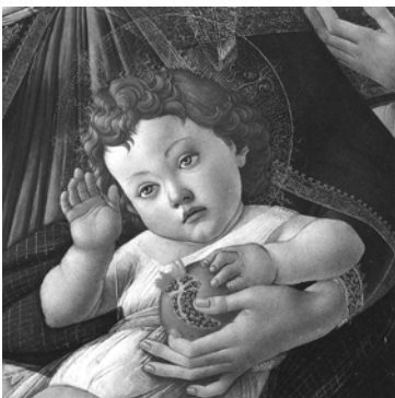
till vänster Detalj av Sandro Botticellis målning "Madonnan med granatäpplet" (c:a 1487).

Vatten, sockertensid, sesamolja, alkohol, tvättaktiva aminosyror, solrosolja, glycerin, äkta eteriska oljor, carragen, macadamianötsolja, granatäppelkärnolja, hirsextrakt, solrosbladsextrakt, xanthan, mjölksyra.