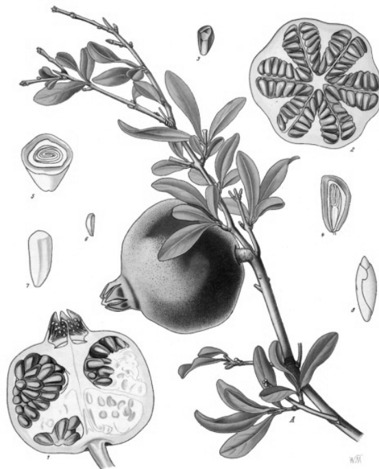
Granatäpple, Punica granatum Bild från Koehler's Medicinal-Plants 1887