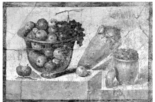
till höger bild från Pompeji